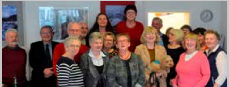
Das sind die ehrenamtlichen AWO-Mitarbeiter/innen.